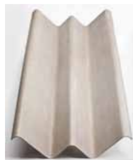
Lámina estructural "M"