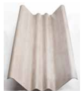
Lámina estructural "V"